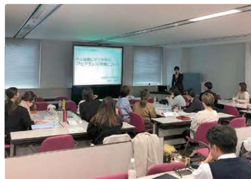
薬剤師から抗がん剤とがん治療中の薬物の副作用などについての基礎知識を受講する様子