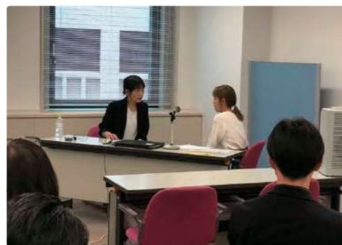
お客様(患者様)とのコミュニケーションマナーを実践的に学ぶためのロールプレイ講習