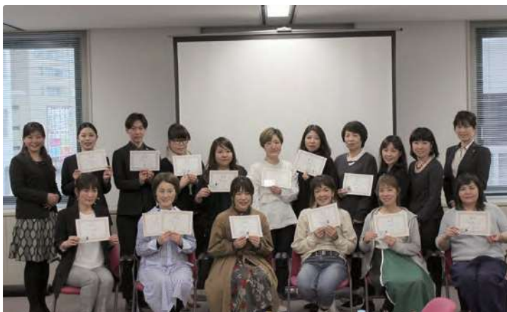
がんや抗がん剤の基礎知識、コミュニケーションマナーを学び認定証を受け取りました

講座修了者の在籍する美容室では、がん患者の希望に応じて、ウィッグのカットや脱毛時のサポート、自毛、再生毛のケアなどを行うほか、NPOが全国から寄附を受けたウィッグを安価に提供することで、がん患者の外見ケアのサポートに寄与している。